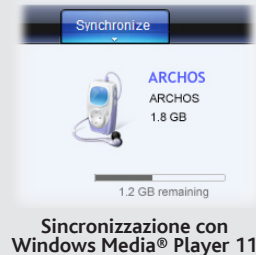
Sincronizzazione con Windows Media® Player 11

Sul computer, avviare Windows Media® Player. 1) Selezionare la scheda Sincronizza. 2) Trascinare i file multimediali che si desidera trasferire nell'area di sincronizzazione del pannello di destra. 3) Fare clic sul pulsante Inizia sincronizzazione. Le canzoni o le foto selezionate saranno copiate direttamente nella cartella Music o Pictures del dispositivo ARCHOS. Per ulteriori istruzioni, consultare la guida di Windows Media Player®. Per ricevere podcast e riprodurli, è possibile usare il software gratuito disponibile su Internet, come il famoso programma Juice, in grado di scaricarli e trasferirli nel dispositivo ARCHOS.