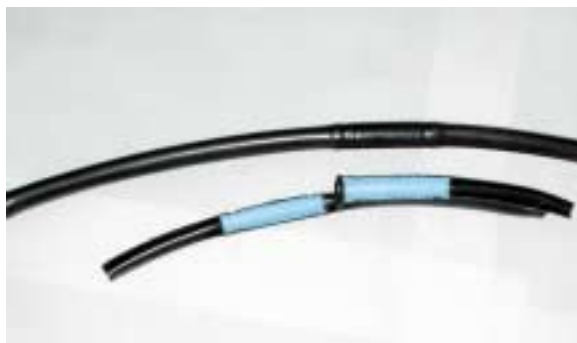
Sezione di ala gocciolante con gocciolatore interno (colore blu). Esistono anche linee con gocciolatori autocompensanti, i quali garantiscono una migliore uniformità di distribuzione, specialmente su terreni non pianeggianti