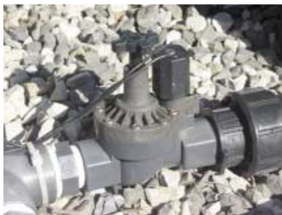
Elettrovalvola per il sezionamento dei settori irrigui. Questo modello di valvola ha una saracinesca per una preventiva riduzione della portata; ciò può essere utile per ottimizzare il funzionamento del fertirrigatore nel caso di coltivazioni con più settori irrigui di diversa superficie