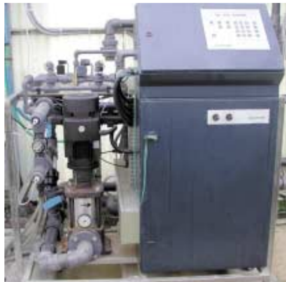
Fertirrigatore computerizzato. Questi sistemi permettono di gestire diverse soluzioni nutritive nei vari settori irrigui