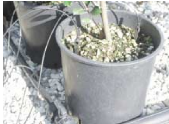
Impianto di microirrigazione con capillare (spaghetto): esempio di linea con capillari pre-montati