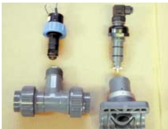
Contaltri a impulsi, necessario per la regolazione delle pompe dosatrici su impianti a controllo volumetrico