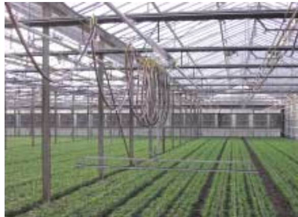
Ala piovana mobile. Questo tipo di impianto è adottato spesso in serra e può essere utilizzato anche per effettuare trattamenti antiparassitari e fertirrigazioni

ventuale suddivisione dell'area di coltivazione in settori irrigui indipendenti (sempre consigliabile);