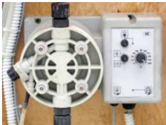
Pompa dosatrice elettrica a membrana. La pompa può essere utilizzata su impianti a controllo volumetrico o proporzionale. Si noti l'interruttore on/off e il regolatore della velocità di aspirazione