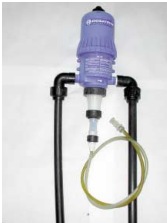
Pompa dosatrice meccanica per fertirrigazione con controllo volumetrico (tipo Dosatron)

valvole e flussimetri installati sul tubo di aspirazione e sulla condotta principale, che naturalmente aumentano i costi dell'impianto;