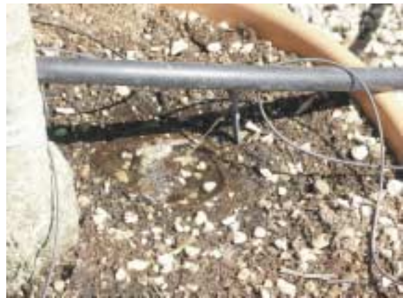
Esempio di erogatore per l'irrigazione a sorsi. Questo tipo di microirrigazione si caratterizza per un'alta portata e per un microgetto che permettono una più uniforme bagnatura del vaso, difetto spesso riscontrato nel sistema a goccia classico (a più bassa portata)