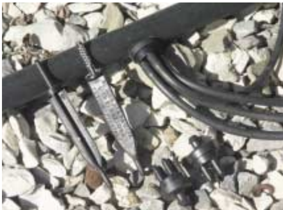
Gocciolatore a freccetta: la particolare conformazione del gocciolatore, con il labirinto nella parte alta

I dispositivi per l'immissione di fertilizzanti (concimi idrosolubili e sali semplici, in ogni caso