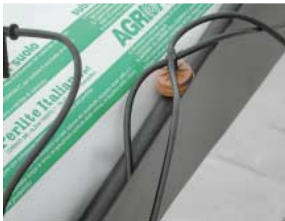
Gocciolatore a bottone autocompensante, con derivatore a 4 vie. Questo tipo di gocciolatore, grazie a una speciale membrana interna, permette un'uniformità di erogazione indipendente dalla pressione (nel range 0,8 - 2 bar). Il derivatore ha lo scopo di poter collegare contemporaneamente 4 punti goccia, al fine di abbattere i costi di impianto