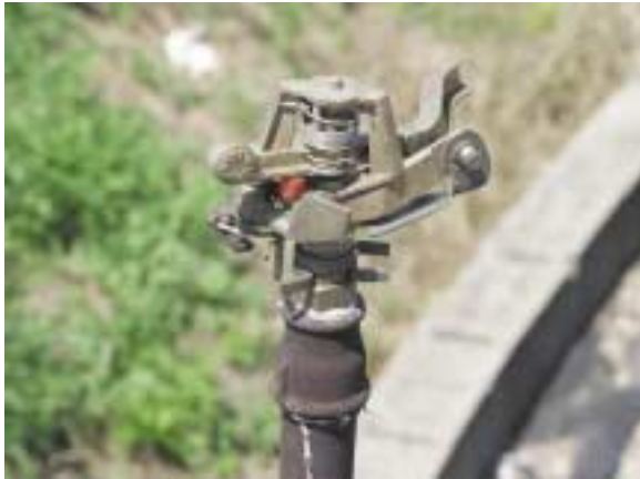
Irrigatore dinamico in ottone a battuta, posizionato su un'asta porta-irrigatore. È questa una soluzione molto utilizzata nel vivaismo ornamentale