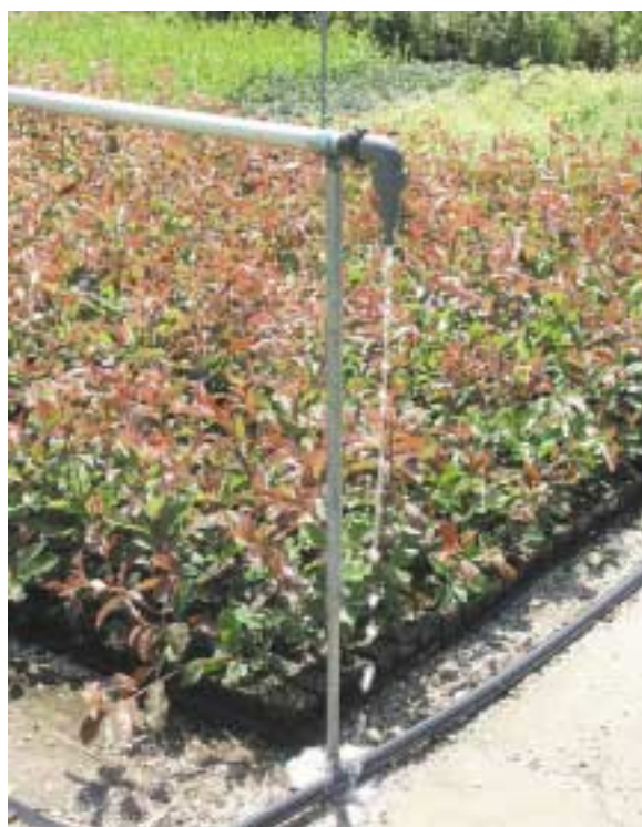
Valvola antigocciolamento, montata alla fine dell'ala piovana. La valvola permette il rapido scarico dell'acqua residua nella linea alla fine dell'intervento irriguo, in modo da evitare il prolungato sgocciolamento dell'acqua residua nella linea stessa sulle piante sottostanti l'ala piovana; questo fenomeno favorisce lo sviluppo di attacchi fungini