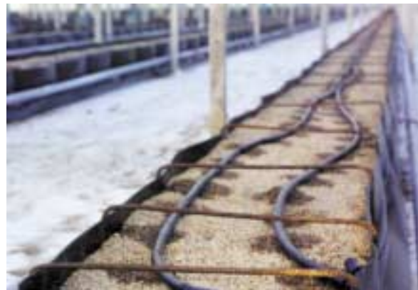
Impianto microirriguo ad ala gocciolante per una coltura su bancale in serra (sopra) o in un vivaio in campo (sotto)