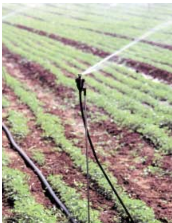
Microirrigatore posizionato su un'asta porta-ugelli. Questa soluzione, alternativa all'ala piovana, permette una semplificazione dell'impianto per la minore pressione necessaria al suo funzionamento rispetto agli irrigatori a battuta

Nella fase di progettazione è fondamentale conoscere: