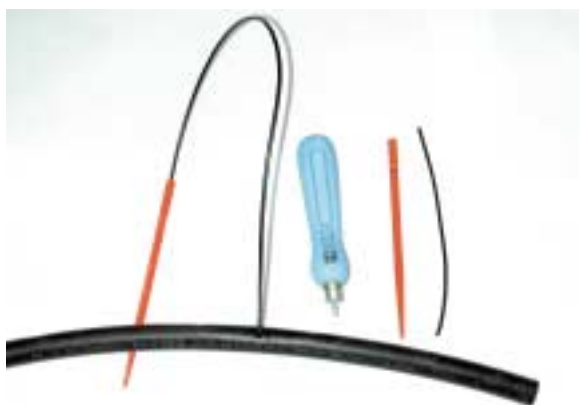
Impianto di microirrigazione con capillare (spaghetto): due capillari con astina e con la fustella utilizzata per forare la linea irrigua