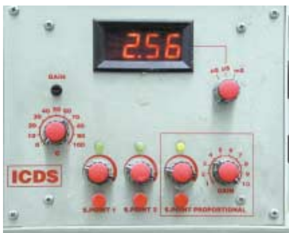
Quadro di controllo di EC per la regolazione di pompe dosatrici in impianti dotati di controllo proporzionale. Si nota, in alto a sinistra, il gain per la calibrazione della sonda, e in basso a destra il regolatore del set-point di EC affiancato sempre a destra dal regolatore della velocità di aspirazione della pompa dosatrice