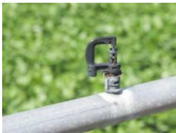
Impianto di irrigazione a pioggia a barra fissa con ugelli dinamici (microirrigatori). A sinistra barra in funzione su colture ornamentali. A destra, particolare del microirrigatore