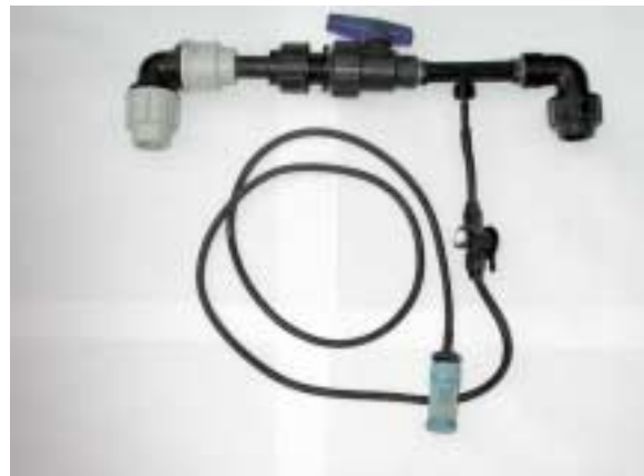
Dosatore tipo tubo di Venturi