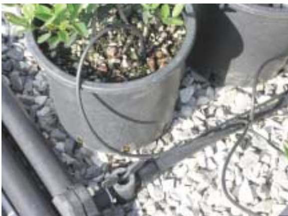
Gocciolatore a freccetta: la disposizione sul vaso

definire i due elementi fondamentali per una corretta scelta dell'impianto: