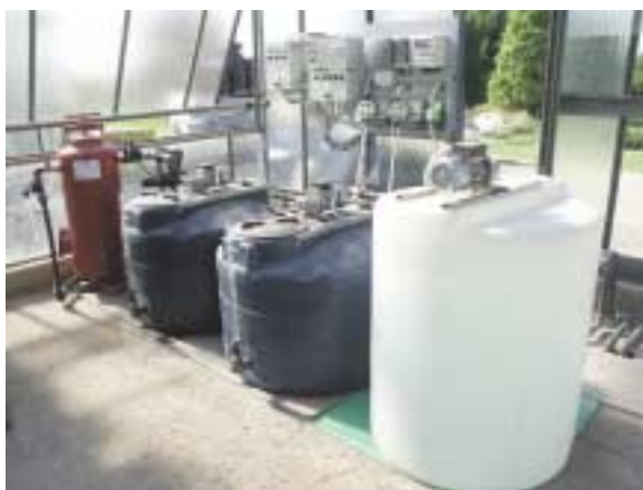
Impianto con pompe dosatrici a membrana con controllo di EC e pH, i due contenitori per le soluzioni stock, quello (bianco) per la soluzione acida (entrambi provvisti di agitatore ad asta), il filtro a sabbia autopulente (sul fondo) e la centralina di controllo con le tre pompe dosatrici