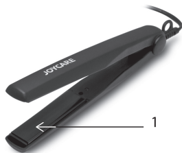
1 - Turmalin kerámia lapok