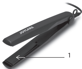
1- Piastre in ceramica tormalina