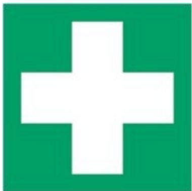
E003 - Pronto soccorso