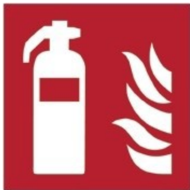
F001 - Estintore