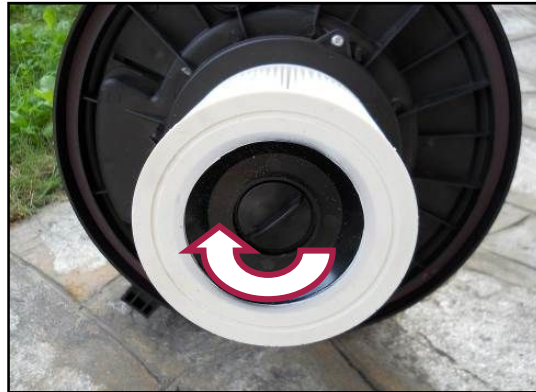
Figura 7 – Montaggio filtro dell'aria