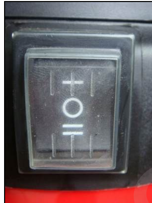
Figura 5 – Interruttore di avviamento/arresto