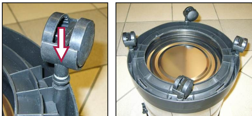
Figura 6 – Montaggio ruote pivotanti