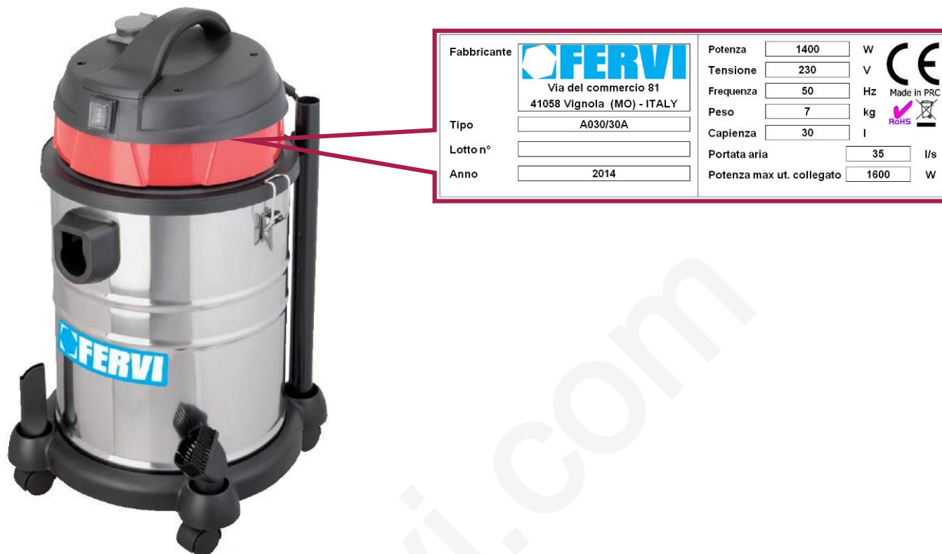
Figura 3 – Targhetta di identificazione

La targhetta di identificazione è applicata sul coperchio superiore dell'aspiratore (Figura 3).