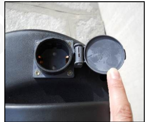
Figura 12 - Presa elettro utensile