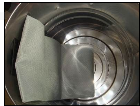
Figura 8 – Montaggio sacchetto polveri