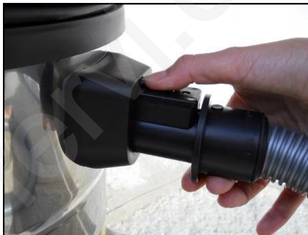
Figura 10 – Sganciamento tubo flessibile