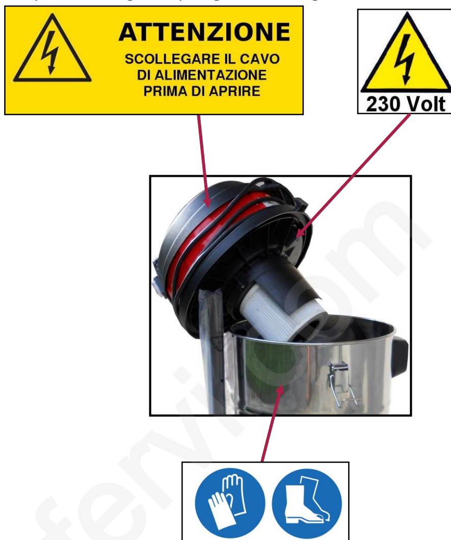
Figura 4 – Pittogrammi di segnalazione ed attenzione

Sulla macchina sono presenti i seguenti pittogrammi di segnalazione ed attenzione (Figura 4):