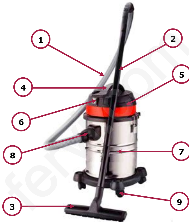
Figura 1 – Parti principali

Maneggevole, facile da usare, facilmente apribile per lo svuotamento ed ispezionabile per le operazioni di manutenzione, l'aspiratore è in grado di rispondere efficacemente a tutte le vostre esigenze di pulizia, dai piccoli lavori di bricolage all'utilizzo professionale.