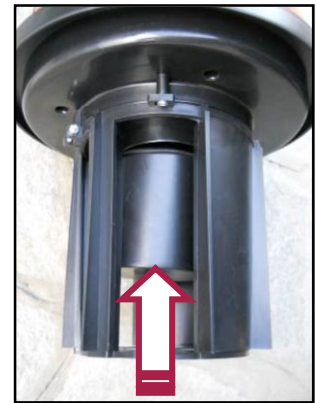
Figura 9 – Galleggiante di sicurezza

Se ciò dovesse accadere, il motore emetterà una rumorosità molto elevata e differente dal normale ed occorrerà spegnere immediatamente la macchina, staccare la spina e svuotare il bidone.