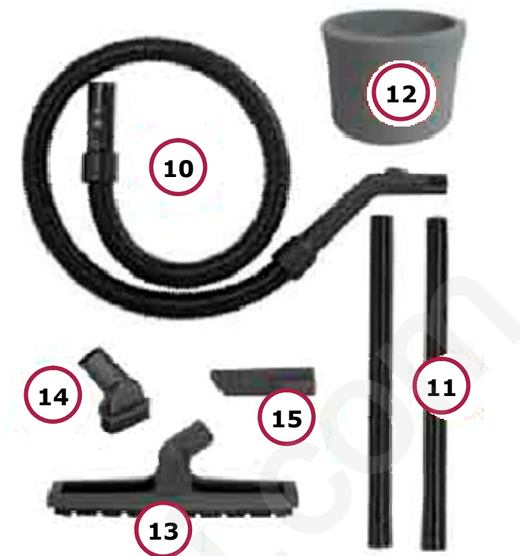
Figura 2 - Accessori