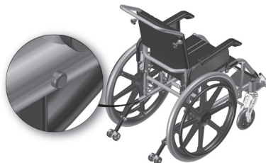
Figura 7.2- Indicação da trava do antiqueda.

b. Trava do antiqueda (figura7.2) deve ser acionada para destravar e retirá-lo da cadeira ou rebatê-lo para cima quando a cadeira de rodas for usada para subir em um obstáculo. No momento que for encaixado ouvir-se-á um click.