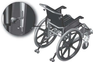
Figura 1.1- Indicação dos pinos de trava do encosto

a. Para dobrar sua cadeira de rodas acione os dois pinos de trava do encosto, localizados na parte de trás da cadeira e dobre-a.