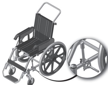
Figura 3.2- Indicação da posição do freio quando não acionado