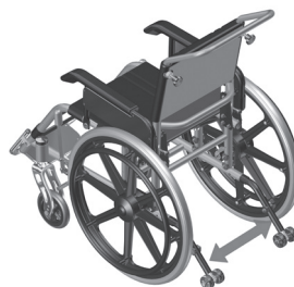
Figura 71-Indicação das rodas antiqueda

a. Rodas antiqueda servem para evitar que a cadeira de rodas caia acidentalmente para trás.