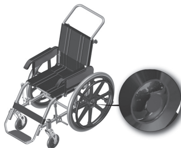
Figura 4.1- Indicação do botão de extração da roda traseira.