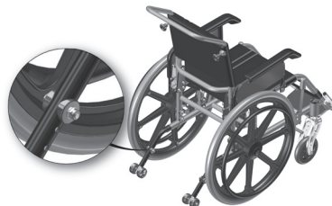
Figura 7.3- Indicação parafuso de sustentação do antiqueda

c. As rodas antiqueda podem ser elevadas ou podem ser abaixadas para alcançar a altura ideal de apoio. Abra os dois parafusos (um em cada lado, detalhe desenho 7.3). Use duas chaves de boca número 10 para abrir, gire no sentido anti-horário para abrir e no sentido horário para fechar. Deslize para cima ou para baixo conforme a regulação da altura das rodas pretendida, conforme furação existente no mesmo. Ambas as rodas devem ter a mesma altura.