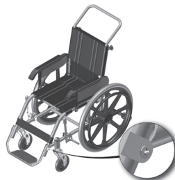
Figura 6.1- Indicação do parafuso de fixação do pedal da cadeira de rodas.

Para ajustar a altura do apoio pé, use uma chave de boca número 10 e uma chave Phillips para abrir os dois parafusos laterais. Gire no sentido anti-horário e deslize o pedal para cima ou para baixo até atingir altura desejada e aperte os parafusos novamente. É recomendado manter um mínimo de 50 mm entre o ponto mais baixo do pedal e o chão, isto proverá liberação adequada para superfícies desiguais e prevenirá danos ao mesmo.