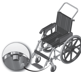
Figura 5.1- Localização do botão de extração da roda dianteira.