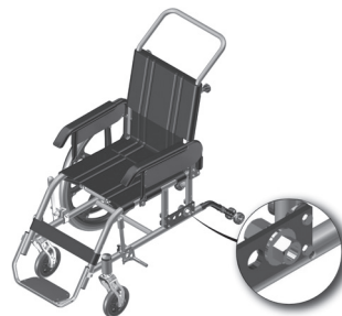
Figura 2.1- Indicação da porca da bucha de sustentação

a. Para regular o centro de gravidade, retire a roda, abra a porca da bucha de sustentação, usando uma chave de boca número 22 e outra chave número 24, mova a bucha para um dos outros furos conforme a regulagem pretendida. Gire no sentido anti-horário para abrir.