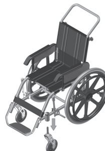
Figura 5.2 - Retirada da roda dianteira.