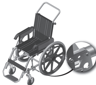
Figura 3.1- Indicação do parafuso para regulagem do freio