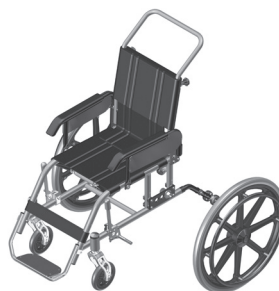
Figura 4.2 - Retirada da roda traseira.