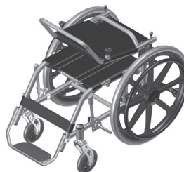
Figura 1.2- Cadeira dobrada

Quando o encosto for retornado à sua posição normal de uso, no momento do encaixe ouvir-se á um click.