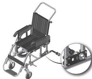
Figura 2.2 Indicação dos parafusos de fixação da placa

b. Para regular a altura, abra os quatro parafusos (cada lado) de fixação da placa, usando duas chaves de boca número 10 e mova-a para cima ou para baixo e aperte os parafusos novamente.