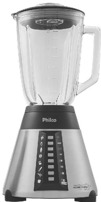
Liquidificador Power 750W PLQ750