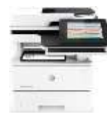
MFP Flow M527z