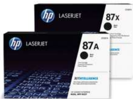
Cartuchos de toner HP originais com JetIntelligence

Aproveite o melhor de seu MFP. Imprima mais páginas em alta qualidade do que nunca 3 usando os cartuchos de toner HP originais especialmente projetados com JetIntelligence. Conte com desempenho superior, maior eficiência energética e a autêntica qualidade da HP pela qual você pagou — algo que a concorrência simplesmente não consegue oferecer. 3