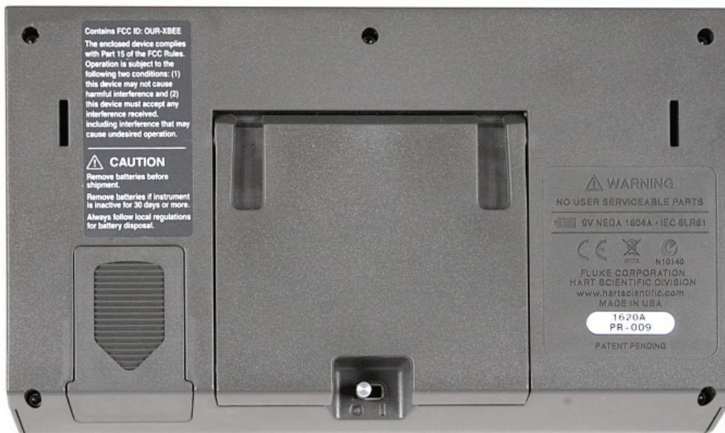
Figura 4. Painel traseiro

Etiqueta de série - A etiqueta de série exibe o modelo e número de série do instrumento.