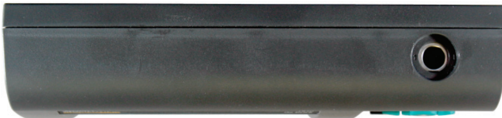
Figura 2. Painel Superior

O painel superior contém a porta para conectar o sensor no Canal 1. Um cabo de extensão opcional poderá ser usado para permitir que o sensor seja colocado em um local mais distante.