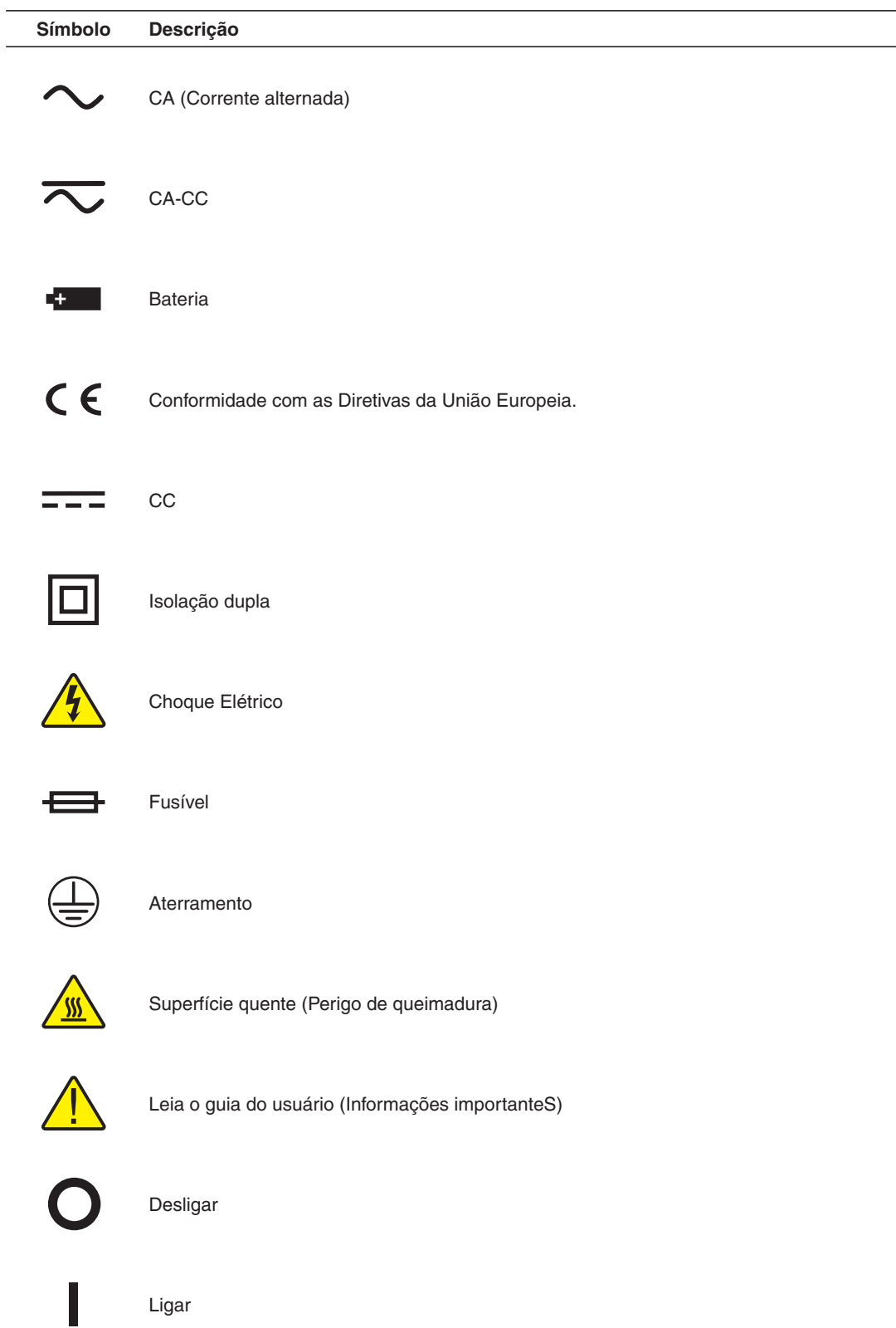
Tabela 1 Símbolos elétricos internacionais