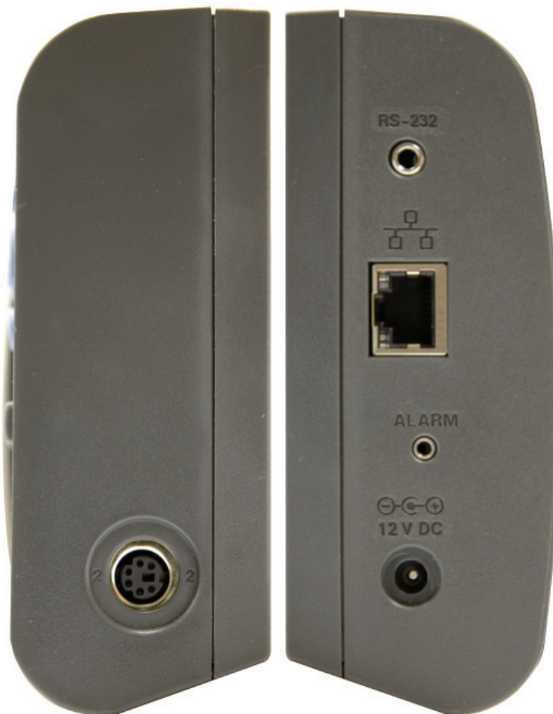
Figura 3. Painéis esquerdo e direito

Entrada de alimentação CC - A entrada CC do adaptador de CA se conecta à entrada de alimentação CC de 12 V para alimentar o instrumento. A entrada aceita um conector miniatura de 5,5 mm. O condutor externo é terra e o interno é positivo. O instrumento pode consumir até 0,5 A.