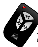
TRS-03 Utiliza 1 Bateria CR2032

Programação válida para todos os modelos de controle remoto Eclipse, inclusive o de presença TRS12 para o modelo TITANIUM PLUS