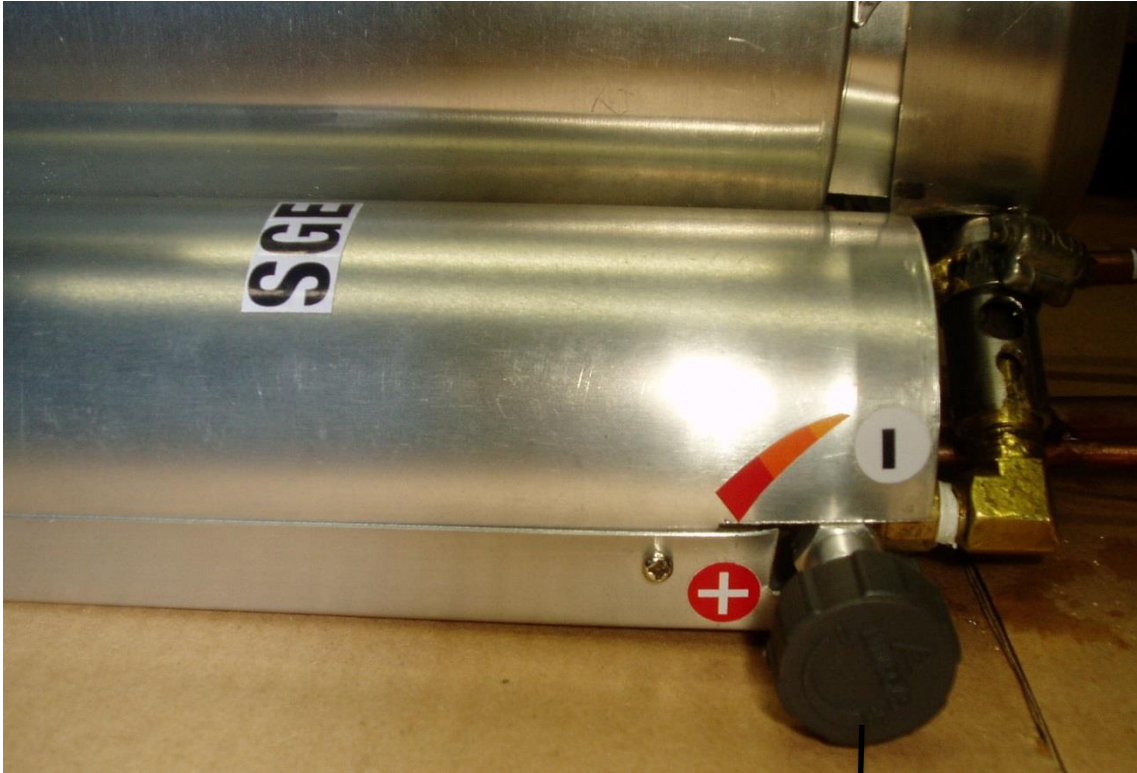
Registro de gás, regulagem de temperatura