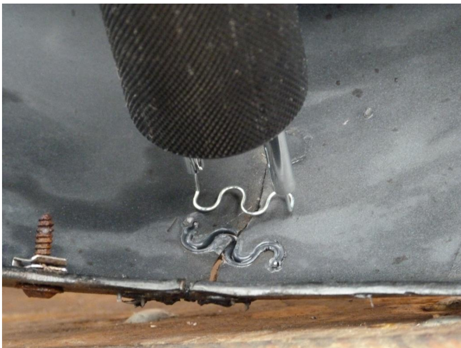
PARAFIX sendo usado no conserto do para-choque

A ilustração a seguir demonstra bem o que o Parafix faz.