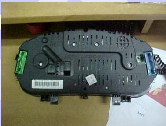
Parte traseira do Painel Golf Motomiter 99/2000