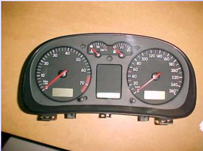
Painel do Golf Motomiter 99/2000