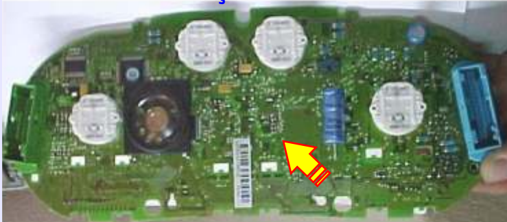
ILUSTRAÇÃO DO CIRCUITO DO PAINEL GOLF MOTOMITER

Circuito do painel desmontado Golf Motomiter 99/2000