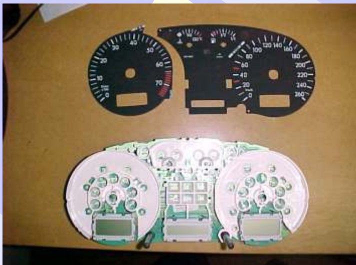
Painel desmontado Golf Motomiter 99/2000