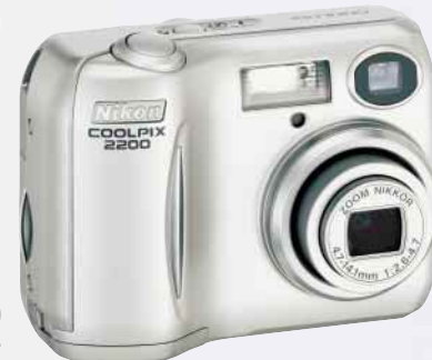
COOLPIX 2200 2,0 megapixels efectivos