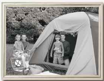
Preto e branco