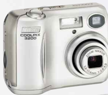
COOLPIX 3200 3,2 megapixels efectivos