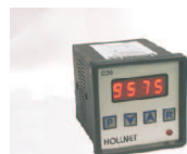
Contador digital modelo C20