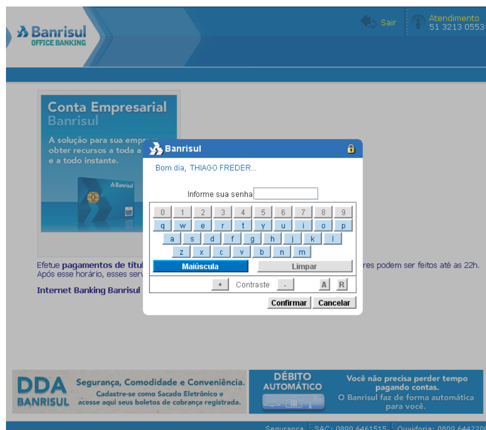
Tela Inicial do Office Banking usando Cartão Banrisul com Chip