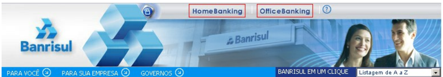
Tela Inicial do Portal Banrisul

Acesse o site do Banrisul ( www.banrisul.com.br ) e clique em Home Banking ou Office Banking na parte superior da tela.