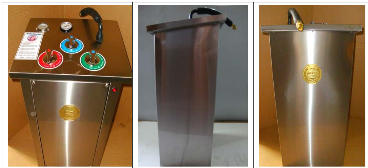
Visão do operador