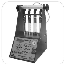
Limpeza e Teste de Injetores