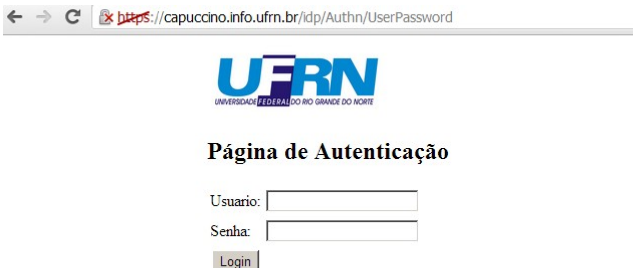
Figura 05 - Autenticação dos usuários

Depois da escolha da instituição (UFRN), deve-se colocar no campo usuário o seu login (o mesmo utilizado para acesso via proxy para docentes e técnicos administrativos ou através do login do SIGAA). Após colocado usuário e senha, pressionar o botão login. Automaticamente a página voltará para a página de periódicos com seu usuário autenticado.