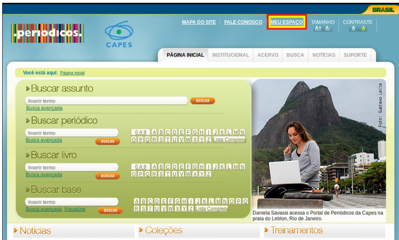
Figura 02 - Identificação do link “ MEU ESPAÇO”

Após o acesso ao portal de periódicos, deve-se clicar no link “MEU ESPAÇO” na parte superior da página, como destacado na figura 02.