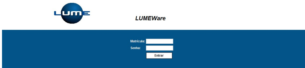
Figura 1 - Tela de Login

A primeira tela apresentada aos usuários do sistema é a tela apresentada abaixo na Figura 1, onde os usuários deverão fornecer a matrícula (matrícula do funcionário na Distribuidora precedida da sigla do estado) e a senha, que a princípio se não foi fornecida à DTCOM, então é a mesma que a matrícula.