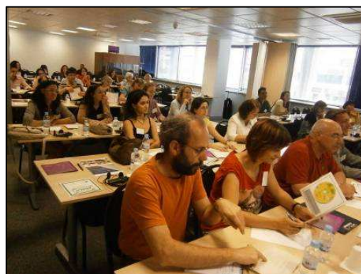
Conferência Final de Lançamento dos materiais ABACO em Madrid

Os materiais ABACO foram oficialmente apresentados durante o seminário que se realizou em Madrid no dia 26 de Maio de 2011. O seminário contou com a participação de mais de 50 pessoas provenientes de diferentes tipos de entidades espanholas, ONG's, ministérios e entidades financeiras. O seminário coincidiu com a visita e encontro de um grupo internacional que dinamiza um projecto no âmbito do programa Europeu Grundtvig, FEFAE – Educação Financeira para Adultos. Foi uma oportunidade para partilhar e aumentar aprendizagens entre as diferentes entidades europeias envolvidas.