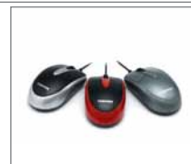
Rato óptico sem fios R300