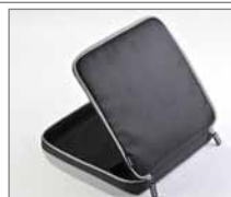
Capa de 10,1" para netbook