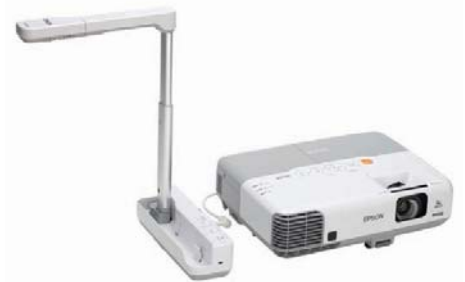
Partilhe objectos 3D utilizando a câmara de documentos ELP-DC06