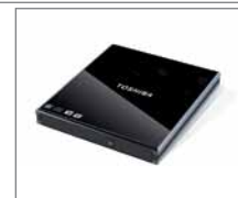
Unidade externa Super Multi