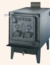
Baron 1880 SP