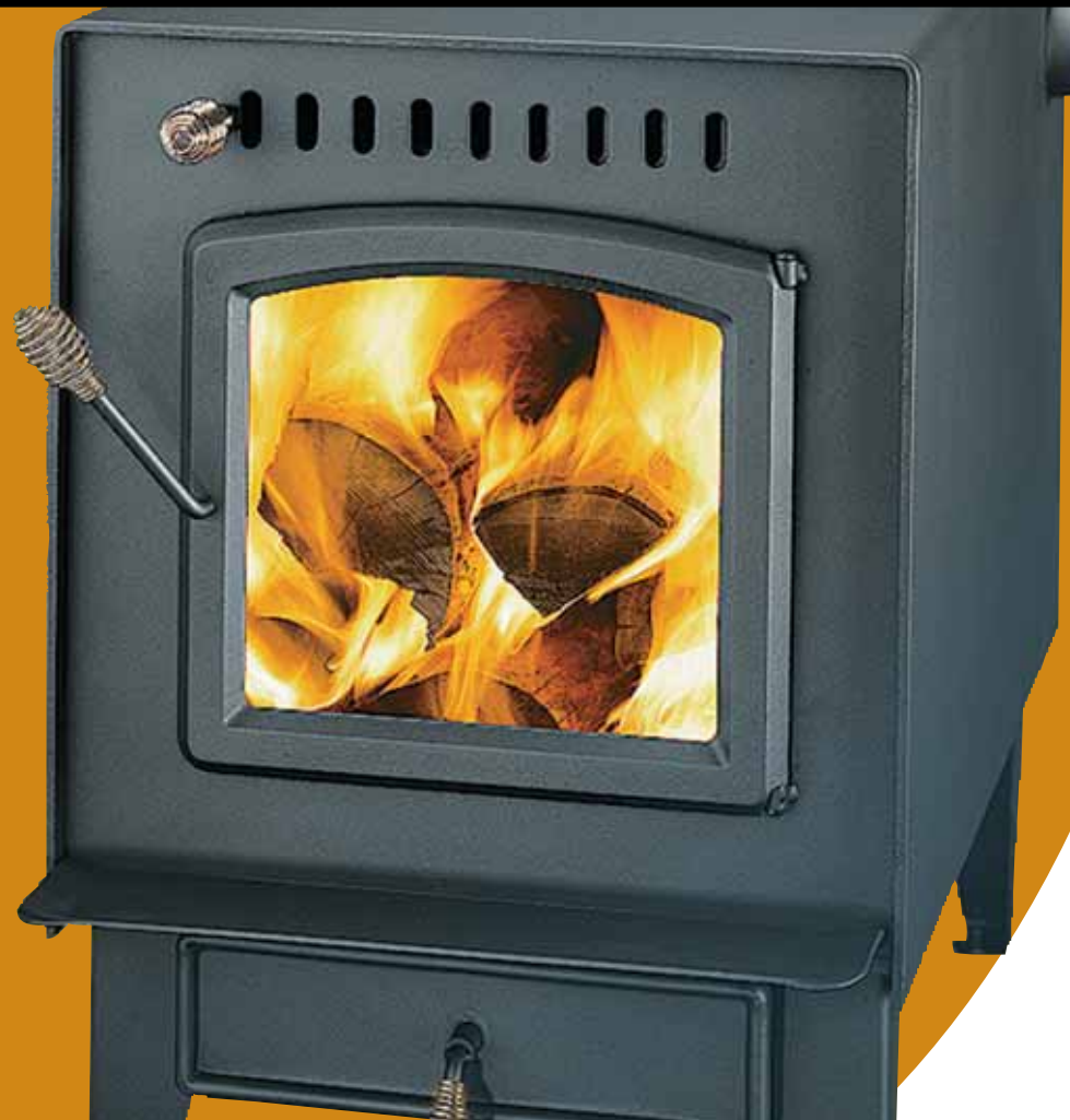
Baron 2000 SP