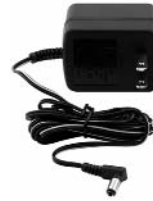
120 VOLT AC CHARGING ADAPTER

Cerciórese de que el resto de las funciones de la unidad estén dadas vuelta APAGADO durante recargar, pues ésta puede retardar el proceso que recarga.