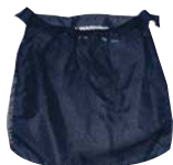
Storage Bag Bolsa para almacenar $7.00