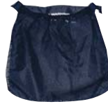
Storage Bag Bolsa para almacenar