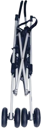
Stroller Frame Estructura de la carriola