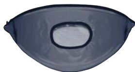
Canopy Sombrilla $9.00

Las piezas de repuesto se pueden ver un poco diferentes de como se muestran abajo.