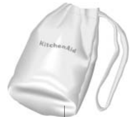
Sac de rangement (modèle 4KHB300 seulement)

Le sac de rangement (modèle 4KHB300 seulement) en coton croisé fermé par un cordon présente trois pochettes pour ranger le corps du moteur du mélangeur à immersion, le pied-mélangeur en acier inoxydable et le fouet. Ce sac de rangement est lavable à la machine.