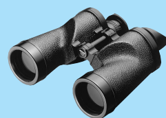
7x50IF HP WP Tropical (Model with L-type scale is also available.)