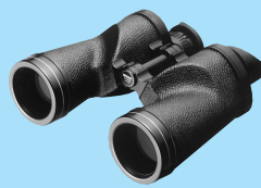
7x50IF SP WP