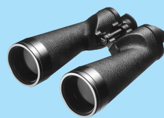
10x70IF SP WP