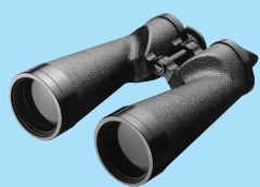
10x70IF HP WP