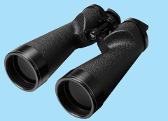
18x70IF WP WF