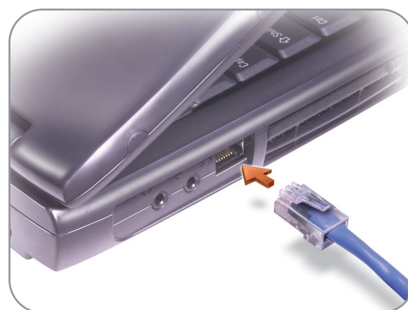
Network Option ネットワークオプション 网络选件