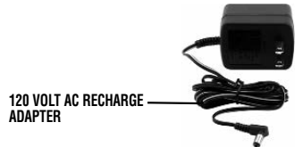
120 VOLT AC RECHARGE ADAPTER

Make sure all other unit functions are turned OFF during recharging, as this can slow the recharging process.