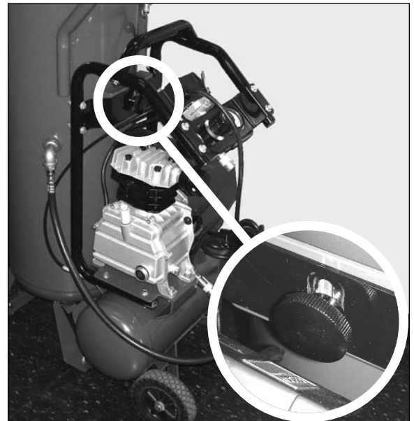
Step / Étape / Paso 2

Replacer le bouton sur le large réservoir pour son entreposage.