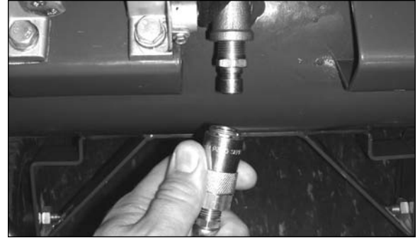
Step / Étape / Paso 1

Replace knob into large tank for storage.