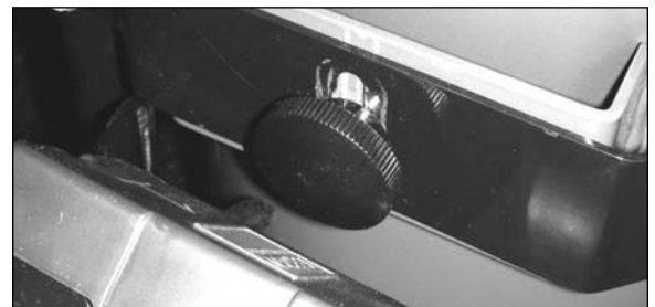
Step / Étape / Paso 3