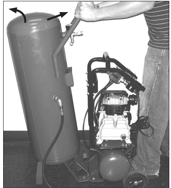
Step / Étape / Paso 2