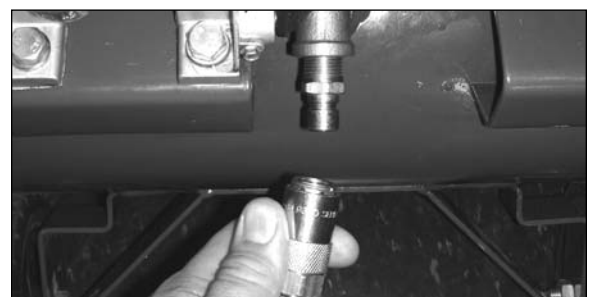
Step / Étape / Paso 4