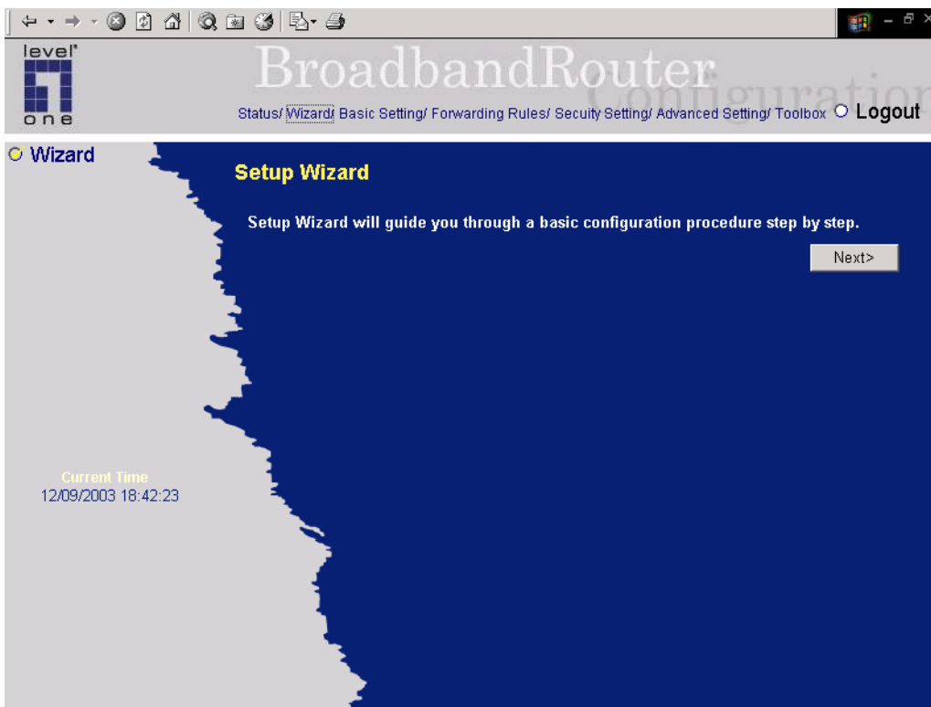
Fig 3 Setup Wizard page